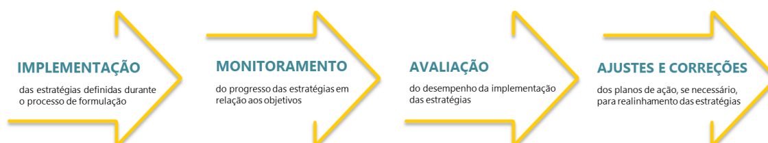
Figura 2 - Processo de Gestão Estratégica