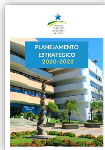
Figura 1 - PE 2020/2023

Após a aprovação do PE, iniciou-se a fase de gestão estratégica, com etapas de implementação, monitoramento e avaliação das estratégias formuladas, a fim de permitir ajustes e correções necessários, de maneira contínua, para responder a mudanças no ambiente interno e externo, assim garantindo que o Tribunal atinja seus objetivos e se adapte a novas circunstâncias.