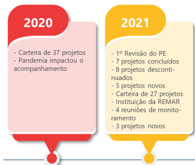
Figura 4 - Linha do tempo do PE 2020/2023

estavam sendo atingidos ou se havia algum tipo de variação em relação ao planejado. Esse processo permitiu a definição de ações corretivas e preventivas, o que possibilitou adaptar prazos, adequar metas, revisar estratégias e propor recomendações aos responsáveis, a fim redirecionar as ações desta Corte e subsidiar as novas iniciativas estratégica para o seguinte Planejamento Estratégico.