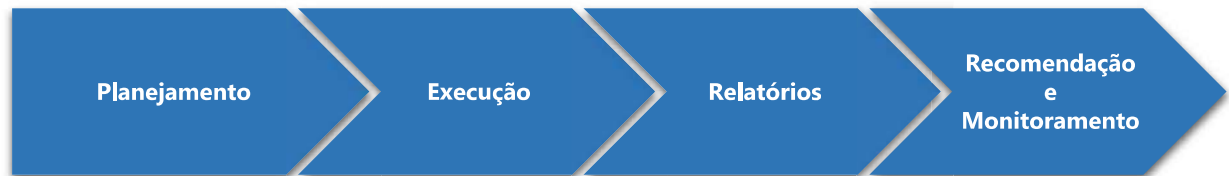
Figura 1 - Fases da Correição

A Correição abordará temas imprescindíveis ao bom funcionamento e ao aperfeiçoamento da unidade organizacional, quais sejam: